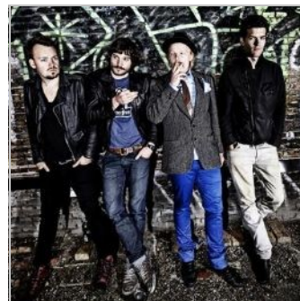
The Floor Is Made of Lava

The Floor is Made of Lava kender man bl.a. for "I Told Her I'm from